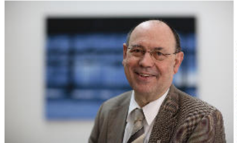
Präses Dr. h.c. Nikolaus Schneider

Es ist sehr verständlich, wenn Sie dieses sehr persönliche Thema an der Grenze zwischen Leben und Tod verunsichert und Sie sich zum Beispiel fragen: Ist die Definition des Hirntodes tragfähig? Fühlt ein hirntoter Mensch noch Schmerzen? Wie wird ein Mensch nach der Entnahme seiner Organe behandelt? Bleibt genügend Zeit und Raum, in Ruhe und Würde von einem Menschen vor der Organentnahme Abschied zu nehmen? Wie verhalten sich Patientenverfügung und Organspende zueinander? Diese schwierigen Fragen lassen sich nicht kurz und völlig eindeutig beantworten. Daher hat der Rat dazu eine gründliche Ausarbeitung in Auftrag gegeben.