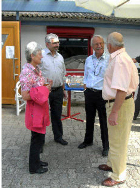
Ehemalige Bläser im Gespräch beim Chorfamilientag am CVJM Haisl

Bei Kaffee und Kuchen waren weitere Gespräche möglich.