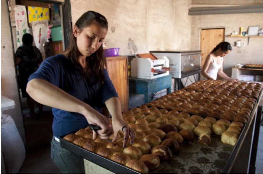
Jugendliche beim Backen

Gott will, dass alle seine Menschen satt werden. Und wir können unseren Teil dazu beitragen.